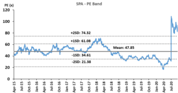
Figure 3: SPA Historical PE-Band